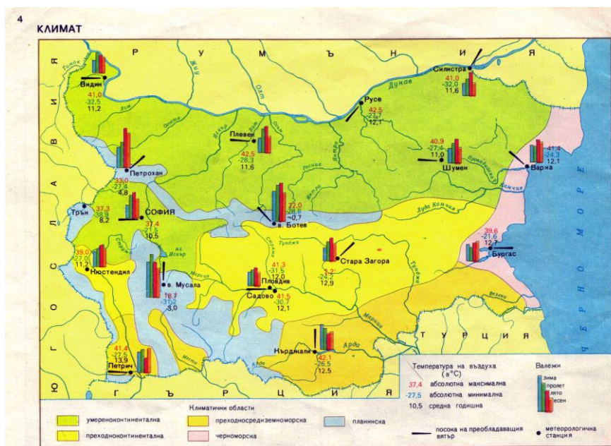
Фигура 1. Климатични области в България

континентален до средиземноморски. В зависимост от териториалното проявление на климатичните елементи и влиянието на климатичните фактори страната ни се разделя на пет климатични области (Фигура 1).